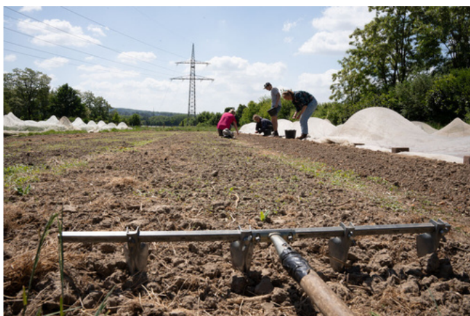
Zwiebeln stecken 2025

Von der Ertragskultur zur Begegnungskultur mit Werner Körsgen